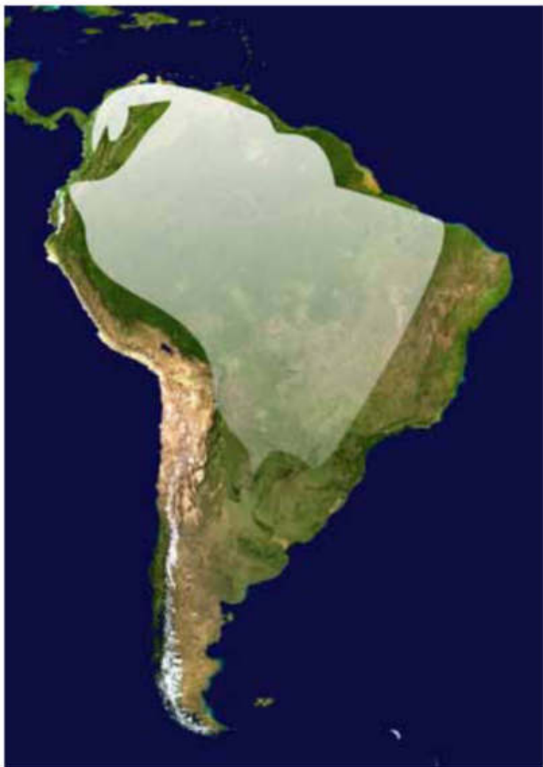
Figura 2. La rana paradójica habita en América del Sur al este de los Andes, desde Colombia hasta el norte de Argentina. En las áreas del Chaco más seco del norte de Argentina, sus poblaciones son frecuentes en charcos temporarios que se forman con las lluvias en depresiones aluvionales relacionadas con los ríos Bermejo y Pilcomayo.

Con las primeras lluvias de noviembre y la formación de charcos, los machos y hembras de la rana paradójica comienzan su actividad. Los machos suelen cantar para atraer a las hembras con más insistencia al atardecer, desde la parte central de los charcos. Las parejas se encuentran y la reproducción se desencadena y comienzan a desarrollarse los renacuajos que se confunden con hojas. Al principio, los renacuajos presentan la cola con un diseño de bandas verticales de coloración claro-oscuro contrastante que va desapareciendo cuando avanza el desarrollo. Dado que muchas veces entre las lluvias de noviembre y diciembre hay un período de 20 a 30 días de intenso calor y sequía, muchos de los charcos donde la rana paradójica se reproduce se secan rápidamente con una alta mortalidad de los descendientes, otros permanecen un tiempo más y serán alimentados por las lluvias de diciembre y los meses siguientes. Hacia fines de marzo y mediados de abril, los renacuajos que sobrevivieron en charcos que no se secaron alcanzan entre 16 y 18 cm antes de iniciar la metamorfosis (Fig. 3).