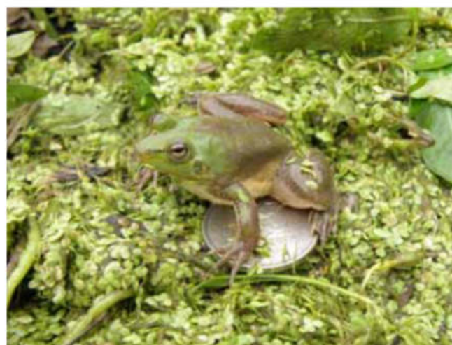
Figura 4. Un adulto de rana paradójica. La moneda de 25 centavos es una referencia aproximada de su tamaño y también nos sirve para comparar con la imagen del renacuajo.

La rana paradójica permanece en el charco donde se desarrolló. La inactividad durante el invierno mientras el charco se seca podría ser simultánea con los procesos de maduración sexual que determinan el inicio de un nuevo ciclo de vida con las primeras lluvias (Fig. 4).