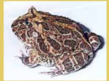
En amarillo, en el mapa, el área de distribución del escuerzo común ( Ceratophrys cranwelli )