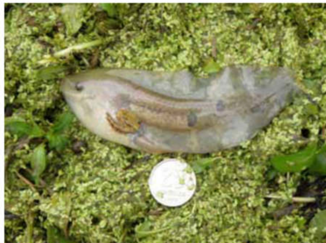
Figura 3. Renacuajo de rana paradójica. A modo de referencia una moneda de 25 centavos. La cola es muy larga y sus aletas bastante altas.

Con las primeras lluvias de noviembre y la formación de charcos, los machos y hembras de la rana paradójica comienzan su actividad. Los machos suelen cantar para atraer a las hembras con más insistencia al atardecer, desde la parte central de los charcos. Las parejas se encuentran y la reproducción se desencadena y comienzan a desarrollarse los renacuajos que se confunden con hojas. Al principio, los renacuajos presentan la cola con un diseño de bandas verticales de coloración claro-oscuro contrastante que va desapareciendo cuando avanza el desarrollo. Dado que muchas veces entre las lluvias de noviembre y diciembre hay un período de 20 a 30 días de intenso calor y sequía, muchos de los charcos donde la rana paradójica se reproduce se secan rápidamente con una alta mortalidad de los descendientes, otros permanecen un tiempo más y serán alimentados por las lluvias de diciembre y los meses siguientes. Hacia fines de marzo y mediados de abril, los renacuajos que sobrevivieron en charcos que no se secaron alcanzan entre 16 y 18 cm antes de iniciar la metamorfosis (Fig. 3).