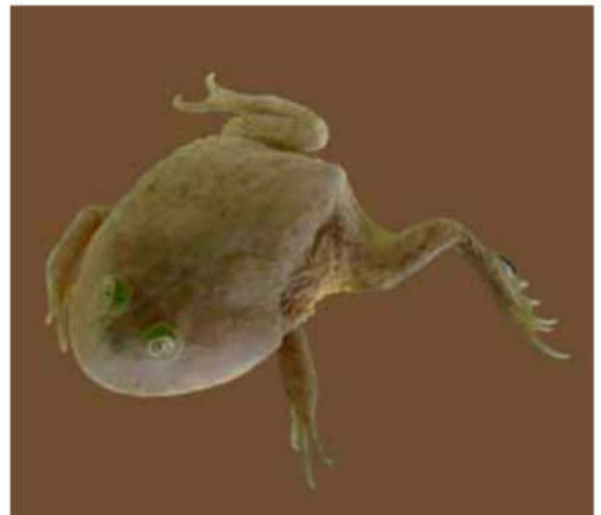
Figura 8: Un individuo juvenil de Lepidobatrachus laevis en el que se observan la forma tan particular del cuerpo y otras características distintivas.

Los escuerzos, y en especial los escuerzos de agua, parecen haber estado muy relacionados con los ambientes del Gran Chaco en donde las condiciones de semi-aridez podrían haber influenciado en sus ciclos de vida al acelerar las etapas larvales. Muchos estudios han demostrado que un desarrollo rápido y renacuajos de gran tamaño son una respuesta a la corta duración de los charcos. La rapidez en el desarrollo y crecimiento de las larvas en estos casos es favorecida por un incremento de proteínas en la dieta larval como ocurre entre los escuerzos. En los anuros de regiones áridas en los que ocurre esto, la metamorfosis se adelanta a la dese-