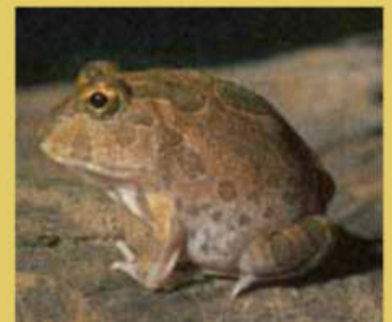
En amarillo, en el mapa, el área de distribución del escuerzo chico ( Chacophrys pierottii ).