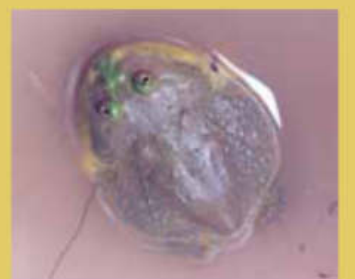
En amarillo, en el mapa, el área de distribución de uno de los escuerzos de agua ( Lepidobatrachus laevis ).

consumir más alimentos que las otras especies; sin embargo tanto la dieta como la cantidad de presas entre ellos difiere. El escuerzo chico tiene un renacuajo que se alimenta de materia orgánica del charco (generalmente algas, vegetación semi-sumergida, cadáveres) que “raspa” o “roe”. El renacuajo del escuerzo común tiene una boca con estructuras duras sobre las mandíbulas que asemejan a un pico de loro con la que despedazan a sus presas (insectos, renacuajos, etc.). Muy