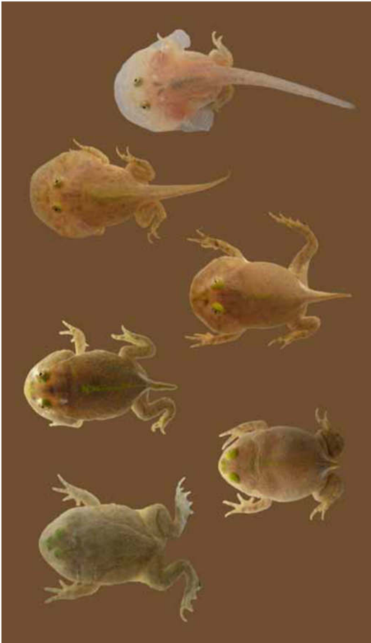
Figura 7: El renacuajo del escuerzo de agua es voraz y crece rápidamente. En menos de dos semanas estará listo para comenzar la metamorfosis, período durante el cual, a diferencia de otros anuros, seguirá alimentándose. La metamorfosis se inicia con el cierre de los sifones y el acortamiento de la cola. A medida que la cola se acorta y atrofia, la mandíbula inferior se redondea y los párpados se vuelven prominentes adquiriendo una coloración brillante y distintiva. La metamorfosis finaliza a los 15 o 16 días después que los huevos han sido fertilizados. Los individuos recién metamorfoseados continúan su vida en el charco donde se desarrollaron.

Hay evidencias fósiles que indican que el grupo de los escuerzos ya se encontraba representado en el Mioceno Superior (Baez y Perí, 1989) y estudios moleculares han revelado que la separación entre los géneros Ceratophrys (escuerzos comunes) y Lepidobatrachus (escuerzos de agua) habría tenido lugar hace 12 millones de años (también en el Mioceno, Ruane et al., 2010). Estos datos son argumentos para sostener que los escuerzos habrían estado presentes en las planicies al Este de los Andes (Patagonia, Sierras Pampeanas-Chaco) ya en el Mioceno. Estas áreas de América del Sur fueron cubiertas durante parte del Mioceno por mares someros, que al retirarse dejaron un relieve y un clima que han sufrido pocos cambios hasta el presente.