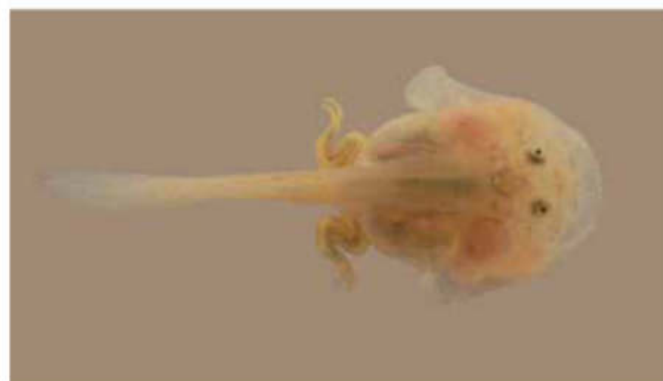
Figura 6: El renacuajo de los escuerzos de agua presenta características que no aparecen en ningún otro anuro. La cabeza es muy ancha, el cuerpo es aplanado, los ojos son dorsales y el agua que entra por la boca pasa por la cámara branquial y sale por los sifones laterales. Las extremidades anteriores a medida que se van desarrollando emergen por esos sifones.

Como en los renacuajos, el metamorfoseado continúa alimentándose bajo el agua, engullendo presas enteras y vivas (ranas de su misma y otras especies, insectos y moluscos). Los ovarios y testículos que no están diferenciados al momento de la metamorfosis, se desarrollarán y madurarán a medida que crecen. La reproducción se inicia al alcanzar entre 7 y 8 cm; las hembras son más grandes que los machos y llegan a medir hasta 13 cm. Los datos sobre la longevidad han revelado que los ejemplares que superan los 10 cm (generalmente hembras) han vivido hasta siete veranos.