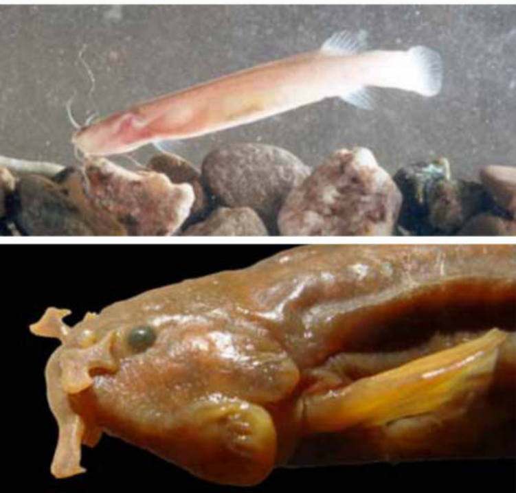
Figura 6: Bagre de montaña endémico de la Cordillera, detalle de la cabeza de Trichomycterus ramosus con las barbillas cortas, anchas y ramificadas dos o más veces, Laguna Blanca, Catamarca.

Algunos autores creen que la gran capacidad para dispersarse ( vagilidad ) de los tricomicteridos se debe a la presencia de los odontoides en los huesos del opérculo e interopérculo (carácter sinapomórfico o condición derivada compartida de la familia Trichomycteridae), que les permite subir contra la corriente anclándose al sustrato o para no ser arrastrados por las crecidas estivales o los deshielos en alta montaña. Y en casos extremos, como los bagres parásitos conocidos como candirú o pez vampiro, también pertenecientes a los tricomicteridos (subfamilias Stegophiliinae y Vandellinae), estas estructuras se modifican como ganchos para ayudar a fijarse a los otros peces mientras se alimentan de la sangre en las branquias ( vandelines ) o del mucus del cuerpo raspando externamente ( estegofilines ) (Fernández 2010).