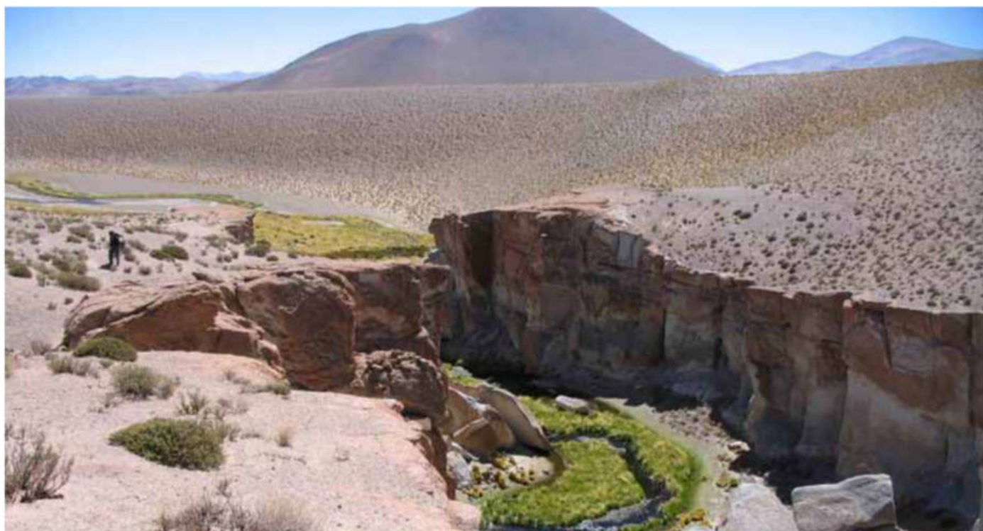
Figura 1: Arroyo del Salar Hombre Muerto a 4.020 m.s.n.m, provincia de Catamarca donde actualmente solo se encuentran las truchas arco iris exóticas.

Por lo general los peces son excluidos de las listas de biodiversidad de vertebrados andinos, presumiblemente porque son menos diversos en altitudes elevadas y a causa del difícil acceso a los lugares de muestreos, donde muchas veces no hay caminos (Figura 1), lo que lleva al escaso conocimiento que se tiene de ellos. Tampoco es raro que los ríos puedan encontrarse secos o bien habitados por las exóticas truchas arco iris (Salmoniformes: Onchorhynchus mykiss Figura 2). En ambos casos será necesario llegar a las nacientes de los arroyos usualmente por arriba de los 2.000 m elevación para verificar su existencia.