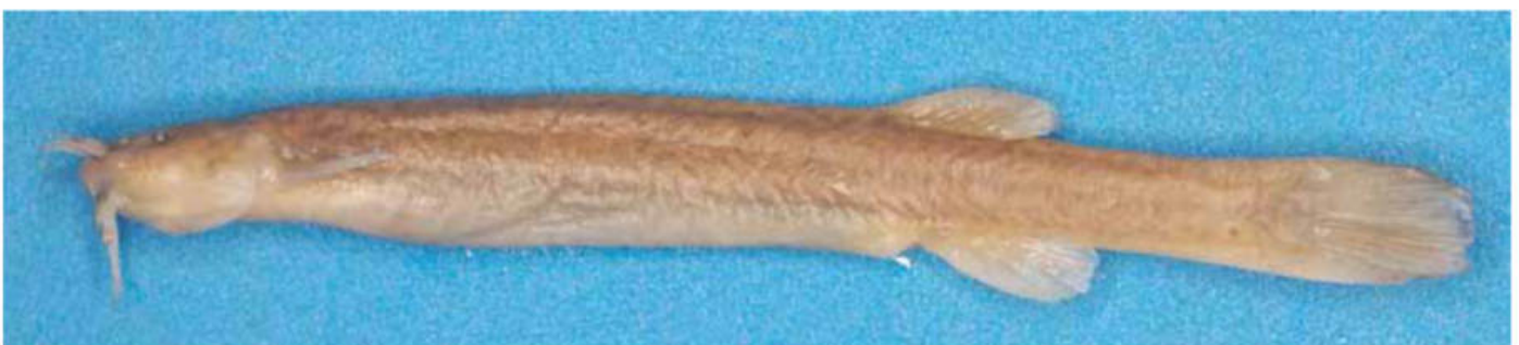
Figura 4: Bagre andino cuyano Silvinichthys leoncitisensis (MCN 1511 holotipo IBIGEO-Museo Ciencias Naturales Salta) que habita en el Parque Nacional el Leoncito 1.213 m, provincia de San Juan.