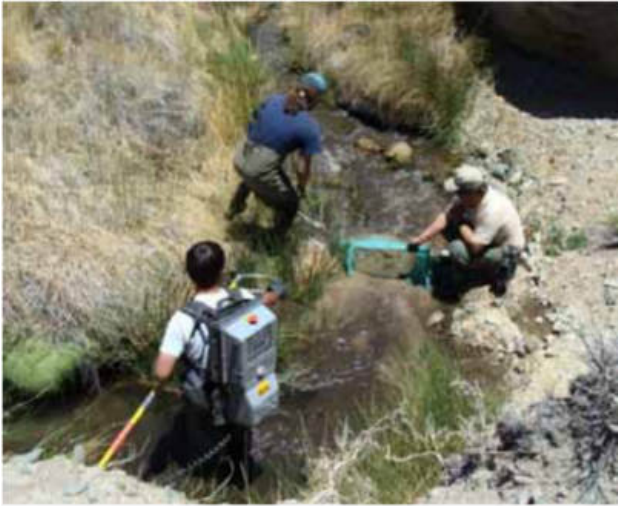
Figura 11: Erradicación de la trucha arco iris en el Parque Nacional Leoncito, San Juan, donde habita Silvinichthys leoncitensis endémica de la Cordillera.

están tomando algunas medidas, como la erradicación de las truchas arco iris (Figura 11) con pesca eléctrica en el Parque Nacional Leoncito en San Juan, donde vive un bagre endémico ( Silvinichthys leoncitensis Figura 4). Pero en las provincias del NOA continúan las políticas de siembra y resiembra en arroyos de cordillera e incluso con mayor difusión de las medidas de protección (Figura 12). Ante la propagación de las truchas, a los bagres nativos de los Andes no le queda otra opción que subir y restringirse en el refugio de las vegas o nacientes de los ríos donde la profundidad del agua es un limitante para la competencia/predación de las truchas (Figura 13).