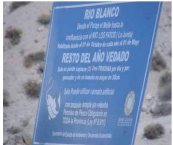
Figura 12: Carteles de protección de la trucha arco iris en la Cordillera: "Habilitado desde el 01 de Octubre de cada año al 01 de Mayo. Resto del año vedado. Solo se puede capturar (3) Tres Truchas por día y por pescador y de un tamaño no mayor a 30 cm. Solo puede utilizar carnada artificial con anzuelo simple sin rebarba".

están tomando algunas medidas, como la erradicación de las truchas arco iris (Figura 11) con pesca eléctrica en el Parque Nacional Leoncito en San Juan, donde vive un bagre endémico ( Silvinichthys leoncitensis Figura 4). Pero en las provincias del NOA continúan las políticas de siembra y resiembra en arroyos de cordillera e incluso con mayor difusión de las medidas de protección (Figura 12). Ante la propagación de las truchas, a los bagres nativos de los Andes no le queda otra opción que subir y restringirse en el refugio de las vegas o nacientes de los ríos donde la profundidad del agua es un limitante para la competencia/predación de las truchas (Figura 13).