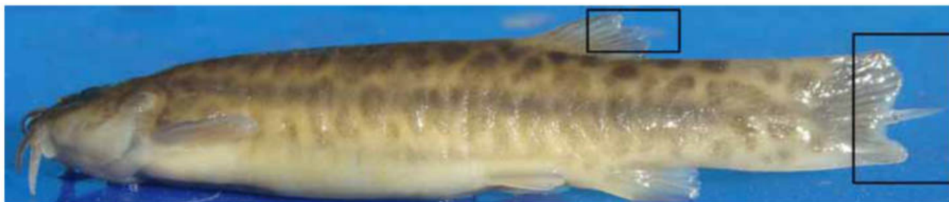
Figura 9: Trichomycterus sp. de un arroyo de la cordillera con la aleta caudal mutilada por la trucha arco iris.

La introducción de la trucha arco iris (Figura 2) en la cordillera (1904) y especialmente en la Puna (1960) no tiene consecuencias menores, debido a que el impacto registrado a la fauna de macroinvertebrados y bagres nativos, algunas veces endémicos, aún está poco estudiado. La invasión de una especie exótica, una vez establecida, difícilmente podrá erradicarse, a diferencia de un contaminante con una fuente emisora localizada que puede controlarse. Por ejemplo, en un arroyo de cordillera, coexiste una especie de Trichomycterus con las truchas arco iris (conocidas por su voracidad (Fernández en preparación)). Cuando el río comienza a retraerse por la sequía aumentan las concentraciones de peces, lo que sumado al menor número de macroinvertebrados bentónicos, hace que en los ejemplares de Trichomycterus se puedan observar aletas mutiladas (Figura 9). Este es el primer caso registrado de que las truchas se alimentan de las aletas de peces nativos andinos. Los registros anteriores son a partir del contenido estomacal de las truchas, pero difícilmente se puedan observar los restos diminutos de aletas con la consiguiente interpretación errónea que las truchas no depredan sobre peces nativos y por ello antes de promover su erradicación se piensa equivocadamente en una explotación sustentable.