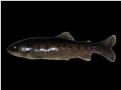
Figura 2: Trucha arco iris Onchorhynchus mykiss obtenida del Parque Nacional el Leoncito, provincia de San Juan.