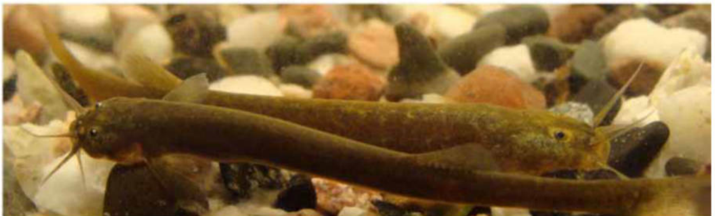
Figura 3: Bagre estigófilo Trichomycterus catamarcensis de la Reserva Biosfera Laguna Blanca 3.500 m.s.n.m, provincia de Catamarca.

con 25 especies distribuidas en tres géneros ( Hatcheria , Silvinichthys y Trichomycterus ), de las cuales 9 corresponden a endemismos (Tabla 1) y de ellos 5 se definen como especies alto andinas (Tabla 1), esto es por encima de los 3.000 m de altura sobre el nivel del mar. En Argentina el mayor registro altitudinal conocido corresponde a Trichomycterus roigi de 4.800 m en la provincia de Jujuy. De los tres géneros de la subfamilia Trichomycterinae en Argentina, los Silvinichthys (Figura 4) son los únicos exclusivamente andinos, entre los 1.000 y 3.000 m de altura. Ocupan a veces ambientes de escasa profundidad (no mayores a 2 cm) como en el Parque Nacional Leoncito en San Juan, o bien en aguas subterráneas como en el río Arenales de Salta (Figura 5) o aguas termales en Los Nacimientos, Catamarca. Es importante destacar que en la Puna Argentina, hasta el momento, no fueron registrados ejemplares de Astrolepidae (Siluriformes), ni del género Orestias (Cyprinodontiformes) como ocurre en ambientes similares del Altiplano de Chile, Bolivia o Perú.