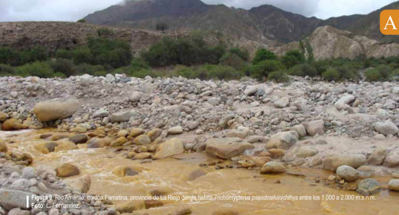
Figura 8: Río Amarillo, cordón Famatina, provincia de La Rioja donde habita Trichomycterus pseudosilvinichthys entre los 1.000 a 2.000 m.s.n.m.