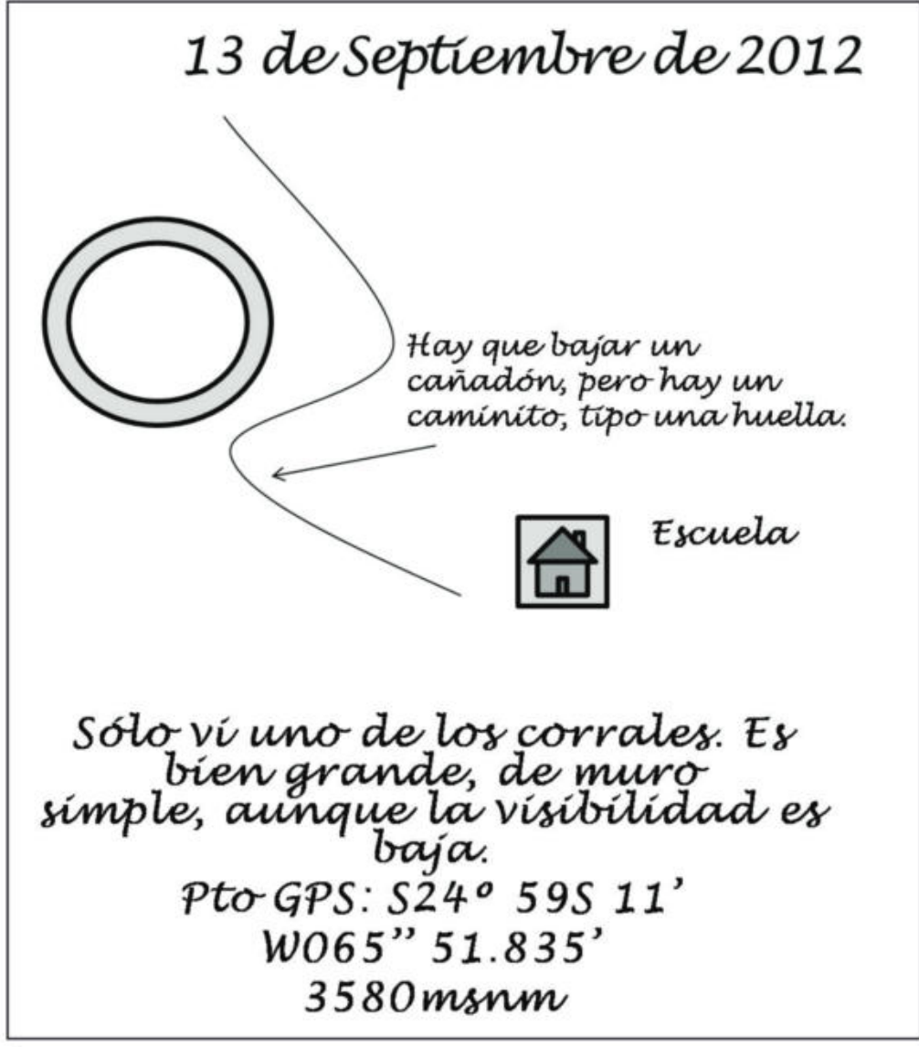
Figura 2. Ilustración de ejemplo de una página de libreta de campo con anotaciones que serán útiles al procesar la información.

según el sedimento, con cucharín y pincel. Cada dato se registra en planillas y hojas milimetradas (donde dibujamos el detalle de ubicación de los artefactos) y también se sacan fotos, todo esto para tener un mejor control del contexto de hallazgo de los materiales. Luego estos materiales son colocados en bolsas con rótulos donde se precisan todos los datos posibles, que posteriormente en el laboratorio nos permitan saber de dónde provienen y junto a qué otros artefactos y materiales se los encontró. Paralelamente, se lleva registro de todos éstos datos en una libreta de campo (Figura 2). En este cuaderno anotamos todo lo que se hace y cada detalle, que en principio puede no parecernos relevante pero luego podría tener sentido. No obstante, hay que aclarar, que las libretas son algo personal, y por lo tanto, el modo y la información que se considera importante o no, depende de cada investigador.