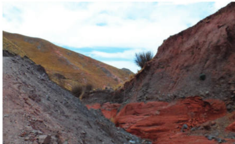
Figura 6. Paisaje, donde se observa la formación geológica de color rojo.