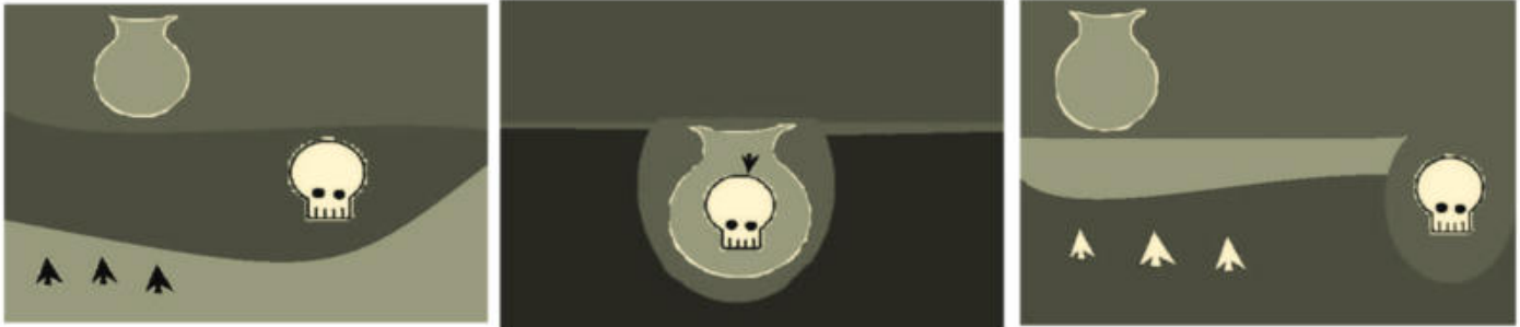
Figura 1. Importancia del contexto. En los tres diagramas se ven los mismos objetos pero asociados de modo diferente, por lo tanto con interpretaciones distintas.