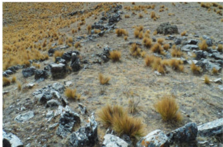
Figura 7. Fotografía de la estructura que denominamos Corral Grande 1.