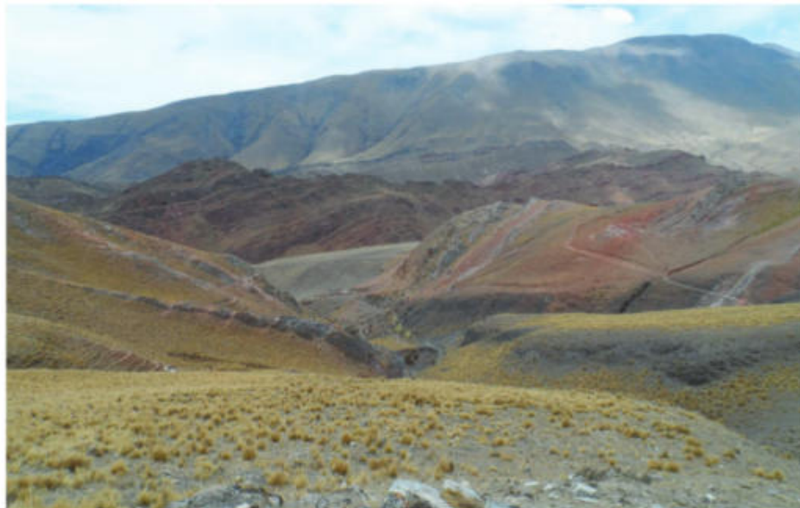
Figura 5. Paisaje general del área. Al fondo se observa el camino de acceso al área.

En principio, se estableció un área de aproximadamente 400 km 2 por fuera y hacia el norte de los límites del Parque Nacional Los Cardones; la escuela n°4587 es el sitio de referencia para el área de trabajo (Mercuri 2013 y Figura 4). A medida que avancen las investigaciones, es probable que estos límites se vean modificados.