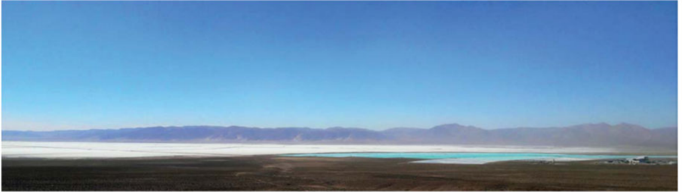
Figura 2. Superficie salina (izquierda) y pozas de evaporación de salmuera para recuperación de litio (derecha) en el salar de Olaroz.

En el plateau andino existen numerosos salares (Fig. 4). Solo en la parte argentina del plateau existen más de 20 cuerpos salinos que merecen interés en términos de su potencial litífero. Este potencial se define en virtud de una serie de características, entre las cuales abordaremos las dos más elementales: la concentración de litio y el tamaño del salar. La concentración de litio en una salmuera representa la cantidad de este elemento (generalmente en miligramos) que está disuelta en un litro de salmuera. Desde ya que, mientras mayor sea la concentración de litio en la salmuera, mayor será la importancia del salar en términos económicos. Cuando las concentraciones de litio en las salmueras son lo suficientemente interesantes, otro aspecto que favorece la relevancia económica de un salar es su tamaño, ya que mientras más grande sea el cuerpo de sal, mayor será el volumen de salmuera contenido y, por ende, la cantidad de litio presente. Detallaremos a continuación estos dos rasgos para algunos de los más importantes prospectos de litio en los Andes de Bolivia, Chile y Argentina (Tabla 1).