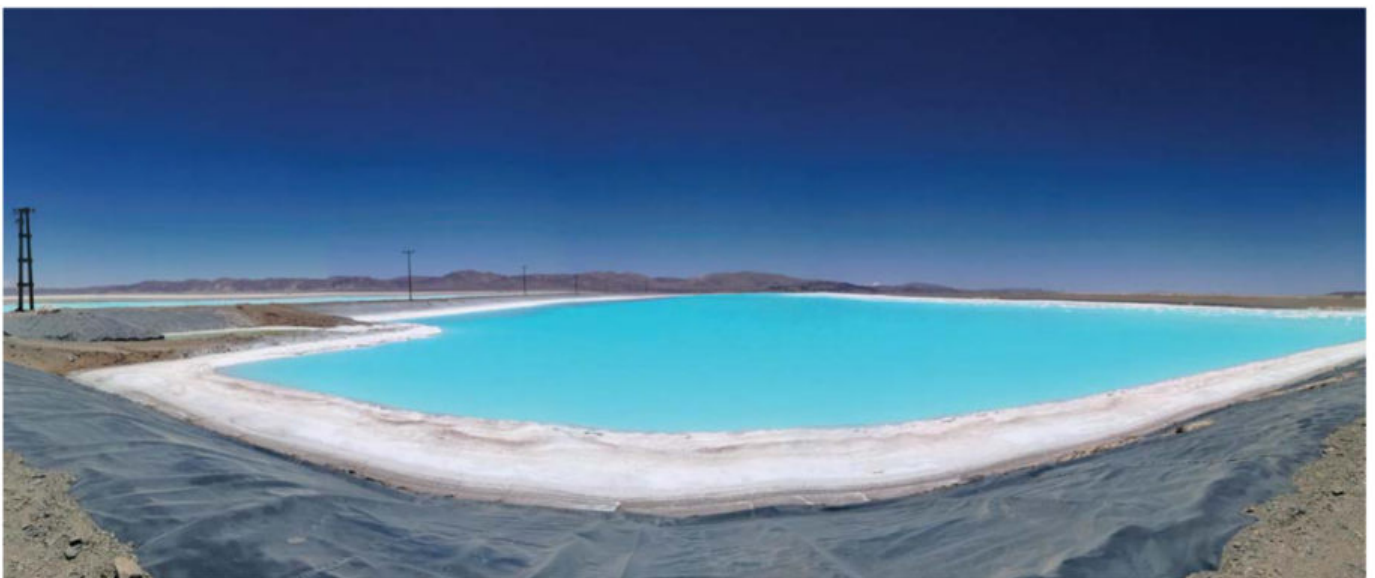
Figura 3. Poza de evaporación de salmuera para recuperación de litio en el salar de Olaroz.

En el plateau andino existen numerosos salares (Fig. 4). Solo en la parte argentina del plateau existen más de 20 cuerpos salinos que merecen interés en términos de su potencial litífero. Este potencial se define en virtud de una serie de características, entre las cuales abordaremos las dos más elementales: la concentración de litio y el tamaño del salar. La concentración de litio en una salmuera representa la cantidad de este elemento (generalmente en miligramos) que está disuelta en un litro de salmuera. Desde ya que, mientras mayor sea la concentración de litio en la salmuera, mayor será la importancia del salar en términos económicos. Cuando las concentraciones de litio en las salmueras son lo suficientemente interesantes, otro aspecto que favorece la relevancia económica de un salar es su tamaño, ya que mientras más grande sea el cuerpo de sal, mayor será el volumen de salmuera contenido y, por ende, la cantidad de litio presente. Detallaremos a continuación estos dos rasgos para algunos de los más importantes prospectos de litio en los Andes de Bolivia, Chile y Argentina (Tabla 1).