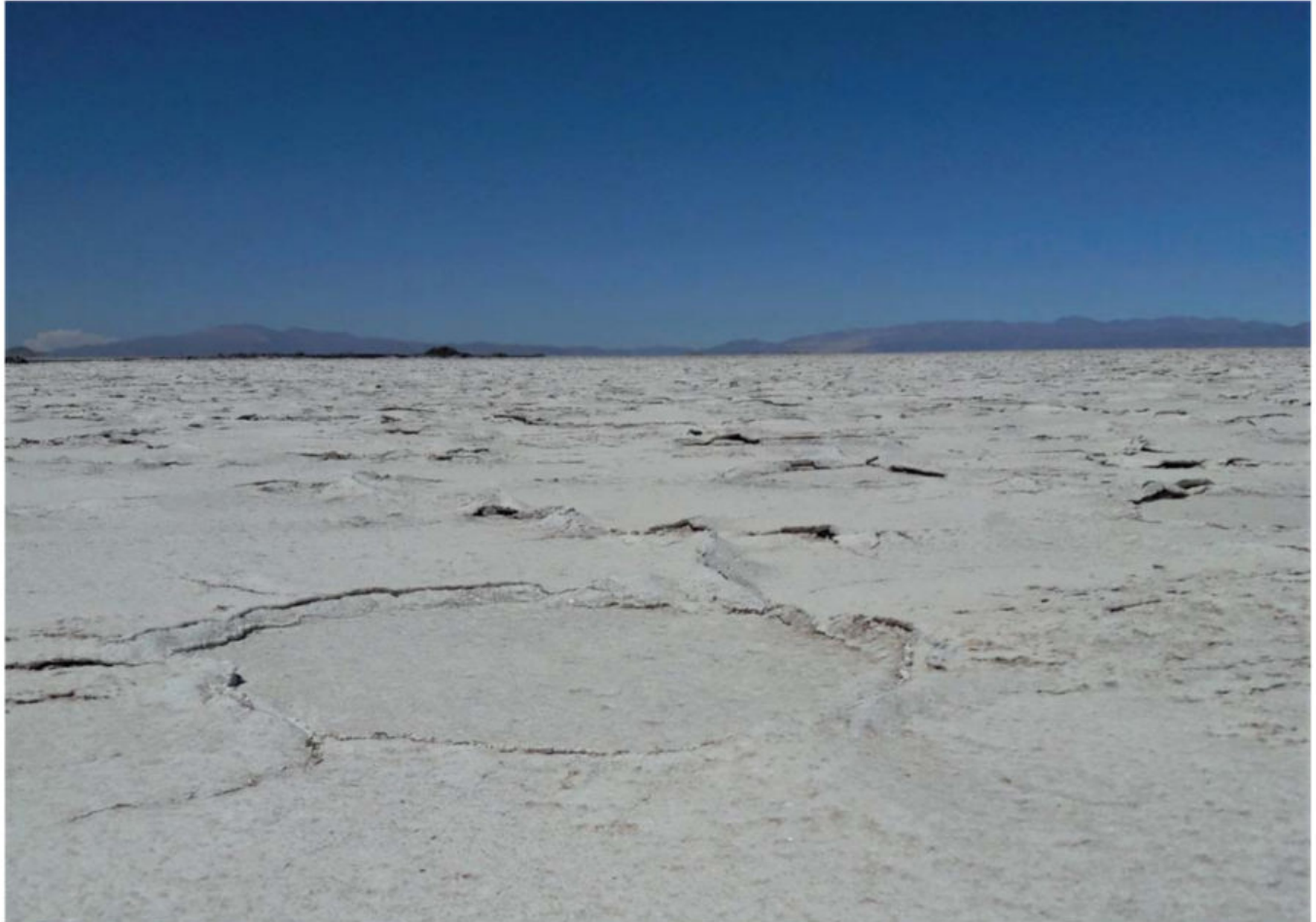
Figura 1. Las Salinas Grandes.

El agua que aún no se evaporó completamente es salobre (es decir, algo salada). Cuando los ríos llegan a un salar, el agua se almacena en su interior. Como en este ambiente el agua está en contacto con las sales, se vuelve, previsiblemente, salada. Justamente, esta agua salada contenida entre las sales y los sedimentos de las cuencas salinas es la que constituye las salmueras que, en el caso de los Andes, son las que almacenan altas concentraciones de litio. De este modo, la minería andina del litio consiste en el aprovechamiento de las salmueras de los salares (Figs. 2 y 3).