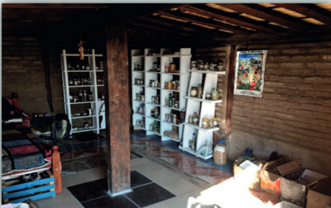
Casa de Semillas, Universidad Campesina (UNICAM-SURI)

Si bien la cancha está desbalanceada, la problemática está siendo visibilizada y las organizaciones de la agricultura familiar, campesina e indígena se están organizando para defender la semilla como base de un modelo de producción popular de alimentos sanos. Casas de Semillas y trabajo de rescate se está realizando en todos los territorios organizados del país para revertir la tendencia y recuperar terreno. Defender la semilla es defender el primer eslabón de la producción de alimentos y la capacidad nacional de transitar un modelo de desarrollo propio. La tarea es difundir esta problemática y apoyar las iniciativas que empoderen el rol de las mujeres y hombres en la protección de este legado histórico de la humanidad.