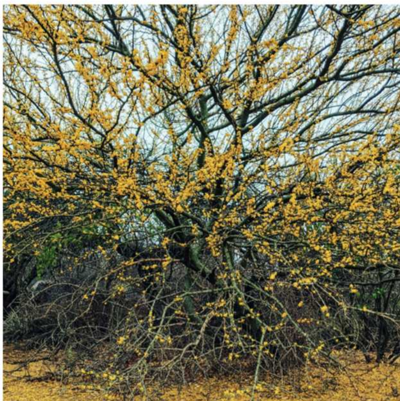
Figura 3. Brea en flor ( Parkinsonia praecox ) en la estación experimental Finca el Paraíso, en el departamento Rivadavia.

El bosque Chaqueño sobrevive gracias a una serie de mecanismos afinados a través de millones de años. Las piezas de estos mecanismos la componen todos los integrantes del bosque que actúan en coordinación como las piezas de un fino reloj suizo. Un claro ejemplo es el del arbusto del género Capparis que junto a una hormiga del género Acromyrmex protagonizan una de las interacciones más sorprendentes de todo el bosque. El arbusto posee unas estructuras llamadas nectarios que producen alimento en forma de azúcares y lípidos, lo que atrae a las hormigas con su delicioso néctar. Sin embargo, el beneficio no es exclusivo de las hormigas. Ante los periódicos ataques de herbívoros, las hormigas despliegan todo el poderío armamentista y marchan como ejército en defensa feroz del arbusto. Así, hormigas y arbustos, coexisten en una estrecha relación mutualista que beneficia a cada miembro del equipo.