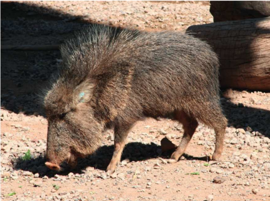
Figura 2. Pecarí Quimilero ( Catagonus wagneri ) fotografiado en el zoológico de Phoenix, Arizona, EEUU.