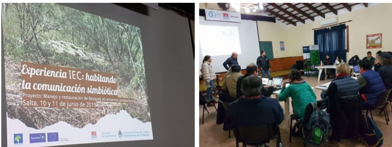
Imagen 1. Distintos momentos de la elaboración de la Versión Técnica Comunicacional

El 10 y 11 de junio de 2019 se concretó en el INTA Cerrillos, de la ciudad de Salta (Argentina) el taller “Experiencia IEC: habitando la comunicación simbiótica” con el objetivo de desplegar colectivamente la estrategia comunicacional del proyecto “Manejo sustentable de bosques en áreas productivas. Convocatoria: Euroclima+” (Imagen 1).