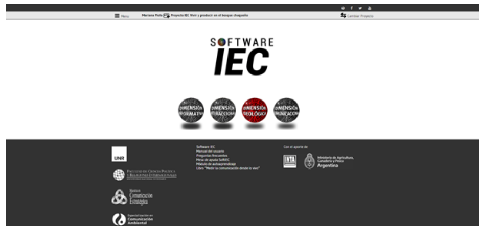
Imagen 5. Captura de pantalla inicial del Software IEC

El Software IEC es un modo de Gestión del Conocimiento a través de un tipo de medición multidimensional que aporta datos vinculados como una posibilidad de reflexión al interior de los equipos interdisciplinarios con la capacidad de reorientar la intervención de un modo más eficiente .