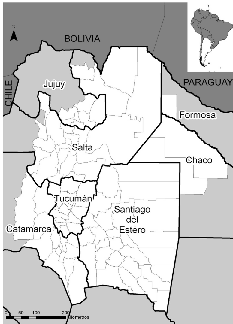
Figura 1. Área de estudio en la región Norte de la Argentina

Estos ecosistemas se encuentran amenazados, con tasas de deforestación que rondan las 230.000 ha anuales (Montenegro et al. , 2008).