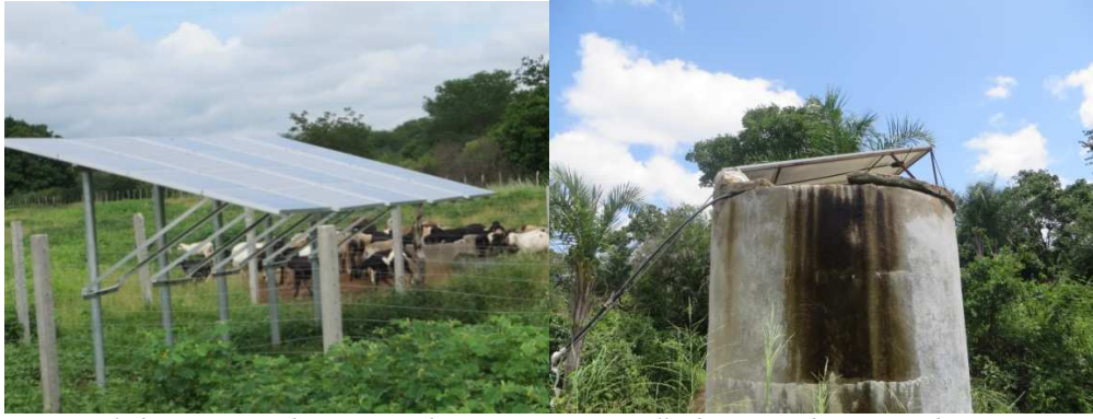
Figura 6: SFBs instalados en Pernambuco: Fazenda Papagaio, Serra Talhada (izquierda) y Brejo da Carapuça, Afogados de Ingazeira (derecha).