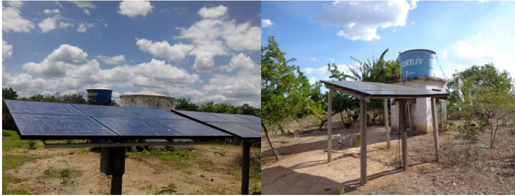
Figura 2: SFBs instalados en Piauí: comunidad Exú, Oeiras (izquierda) y Poço de Peixe, Floriano (derecha).