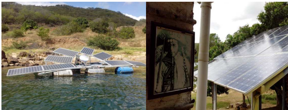
Figura 5: SFB y Sistema fotovoltaico conectado a la red instalados en el restaurante Grota dos Angicos, Canindé do São Francisco.

En una de las márgenes del Río São Francisco, en la zona fronteriza de los estados de Alagoas y Sergipe, se encuentra una iniciativa familiar de turismo gastronómico. Se trata del Restaurante Angicos ubicado en el municipio de Canindé do São Francisco, local próximo del lugar donde en 1938 mataron al legendario bandolero Lampião. Ese emprendimiento consideró la instalación de un SFB flotante y un sistema fotovoltaico domiciliario (SFD), como se puede observar en la figura 5. Esos sistemas fueron visitados en setiembre de 2013 y se pudo verificar que después de varias modificaciones el SFD se encontraba conectado a la red eléctrica y el SFB que utilizaba un inversor de frecuencia importado estaba parcialmente desactivado. Para obtener más informaciones sobre esa iniciativa consultar Barbosa et al. (2007) y Valer et al. (2014).