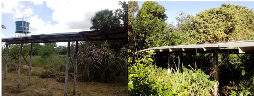
Figura 3: SFBs instalados en Ceará: comunidad de Iapara y Vaquejador, Granja (izquierda) y BomJesus, Itapipoca (derecha).