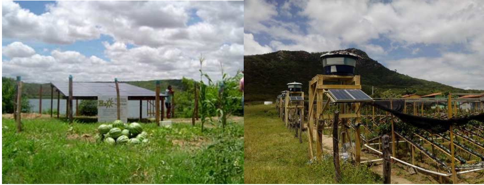
Figura 4: SFB instalado en Sítio Traíras, Pão de Açúcar cuando estaba operativo en 2006 (izquierda) y sistema fotovoltaico para la producción hidropónica de pimienta en São José da Tapera (derecha).