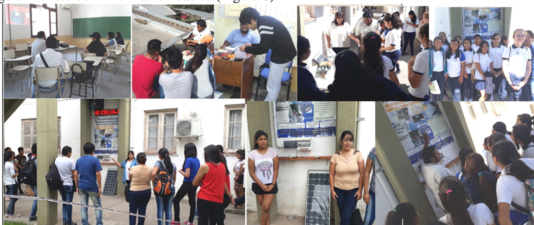
Figura 8: Diferentes instancias de las visitas Guiadas

En cada visita, el grupo de estudiantes vino acompañado por un profesor. El expositor (miembro del equipo de la Centralita) comenzó la charla indagando sobre sus conocimientos previos acerca de la tecnología fotovoltaica. La gran mayoría identifica los paneles solares, pero desconoce cómo es el proceso de generación, por lo que se les muestra cada componente de la estación: los paneles en la terraza, el gabinete con cada componente y su interconexión; solo en casos puntuales se realizaron mediciones. A modo de cierre se les invitó a cargar sus celulares, a reflexionar sobre la importancia de trabajar con otras energías alternativas. Finalmente se atendieron inquietudes personales y se les entregó un folleto con información básica (Figura 8).