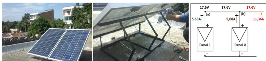
Figura 4: Paneles instalados en la terraza, conectados en paralelo.

Las dimensiones de cada panel son: 1,10 x 0,67 x 0.035 m lo que da un área de colección de 0,737 m 2 . La energía entregada al cabo de 8 horas por cada panel es 720 Wh/día, por lo que el sistema completo puede entregar hasta 1400 Wh/día.