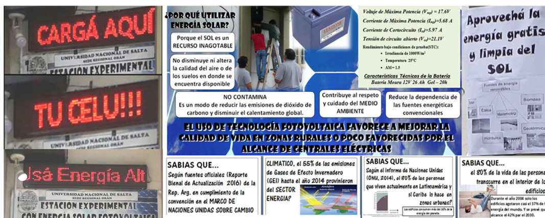
Figura 6: Cartelera que acompaña la Centralita FVCel

En la Centralita, el mensaje principal de la cartelera fue el aprovechamiento de la energía solar en forma gratuita, limpia, no contaminante. Se consideró de suma importancia enfatizar que se trata de una fuente inagotable, que contribuye al respecto y cuidado del medio ambiente, que para zonas rurales el uso de la tecnología fotovoltaica contribuye a mejorar la calidad de vida. Así también se colocaron algunos datos relevantes como el porcentaje de emisiones de Gases de Efecto Invernadero, el porcentaje de la población de zona urbana, el tiempo que se transcurre dentro un edificio, entre otros, con la finalidad de invitar a tomar conciencia sobre el aumento del consumo energético y la necesidad de comenzar a indagar sobre otras fuentes de energía. También se instaló y programó un cartel luminoso autoabastecido, con mensajes de invitación a cargar los celulares con energía fotovoltaica. Como la centralita está instalada en el patio delantero, de la sede, toda persona que ingresa lo puede ver. La elección de la ubicación fue estratégica para la difusión (Figura 6).