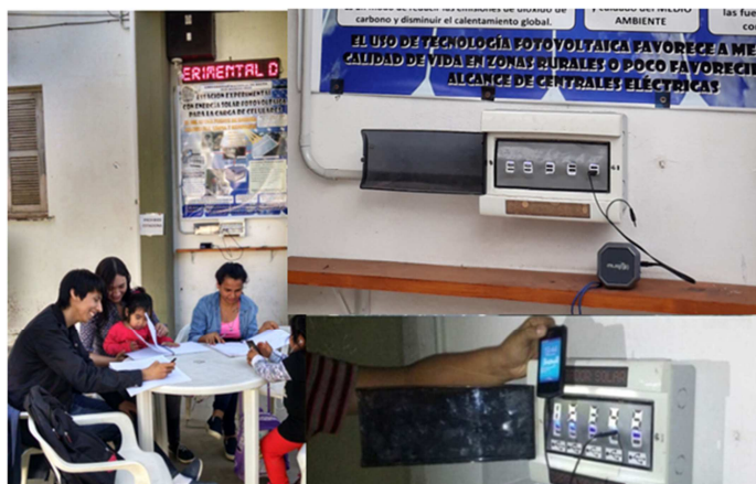
Figura 5: Centralita FVCel, en uso por los estudiantes

El sistema de distribución está conformado por 10 conectores USB identificados con números y leds encendidos permanentemente para indicar si la estación está disponible, y que junto al sistema de Stand By, requieren aproximadamente de 1W (Figura 5). Las características eléctricas de los conectores son las que se concibieron en el diseño: 8 trabajan a 5V y pueden entregar corriente máxima de 1A (potencia de 5W), y 2 entregan hasta 2A (potencias de 10W).