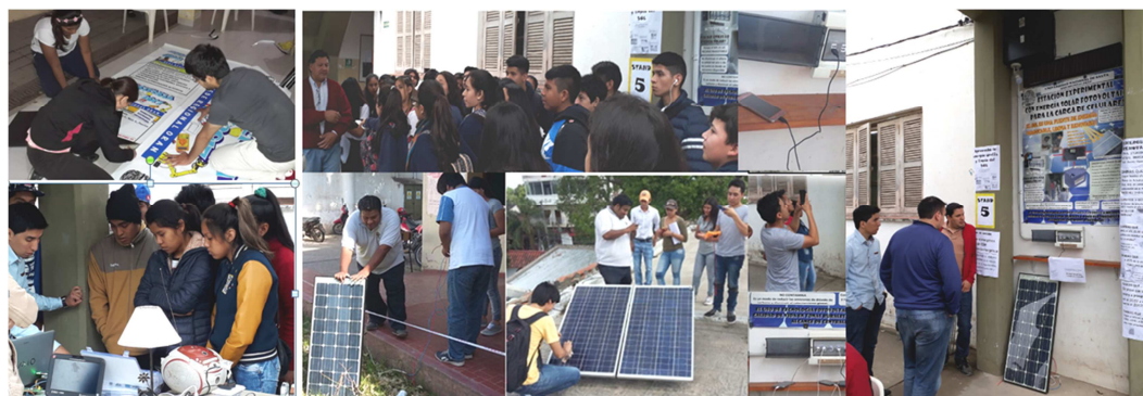
Figura 7: Difusión de la energía Fotovoltaica en la Fericiencia

A alumnos del nivel primario se les explicó con un lenguaje sencillo los componentes y el funcionamiento de la estación y la obtención de la Energía fotovoltaica, pudiendo apreciar su interés y escucha atenta y respondiendo a sus inquietudes. Con alumnos del nivel secundario, el trabajo fue un poco diferente. Mediante la indagación previa se buscó determinar su conocimiento previo del tema, para luego proseguir con la explicación del funcionamiento de un panel, el efecto fotovoltaico y la interconexión de los componentes de la estación. Luego, organizados en grupos, accedieron a la terraza donde están instalados los paneles. Finalmente, ya en la estación realizaron cargas de sus propios dispositivos móviles (Figura 7).