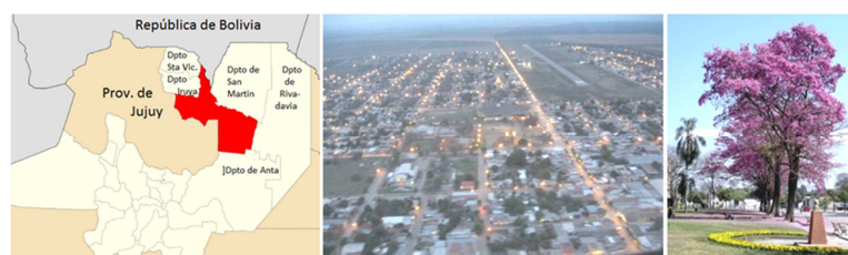
Figura 1: a) Ubicación geográfica del departamento de Orán en la Provincia de Salta, b) vista aérea de la ciudad, c) plazas cubiertas con lapachos, especie característica de la zona.

El clima de Orán es subtropical serrano: presenta veranos desconfortables durante las 24 horas del día debido a las temperaturas, humedades y precipitaciones elevadas, mientras que los inviernos suelen tener temperaturas agradables durante el día y noches frías. En la tabla 2 se presentan estadísticas climatológicas normales para la Ciudad de Orán, periodo 1981-2010, correspondientes a los meses de verano e invierno (Servicio Meteorológico Nacional, 2018).