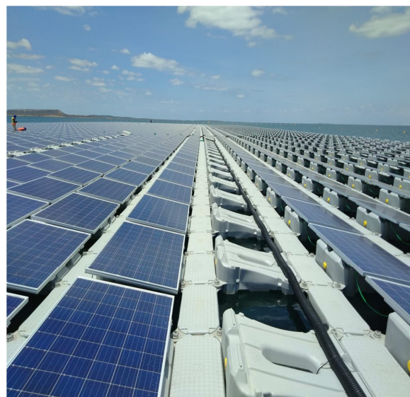
Figura 1: Bancada de testes utilizada nas medições justaposta à UFF- 1MWp Reservatório UHE de Sobradinho-Chesf