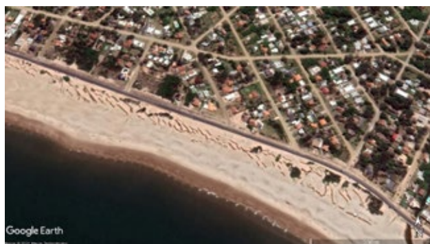
Figura 2. Cercas captoras de arena.

A medida que se avanza desde Oeste a Este con el reingreso de la arena a la costa, se complementa la acción, mediante la instalación de cercas captoras de arena, que fueron realizadas manualmente, con ramas de podas entrelazadas, que se colocan en forma horizontal sobre el sustrato al que se fijan mediante ramas colocadas en sentido vertical (Figura 2. Cercas captoras de arena).