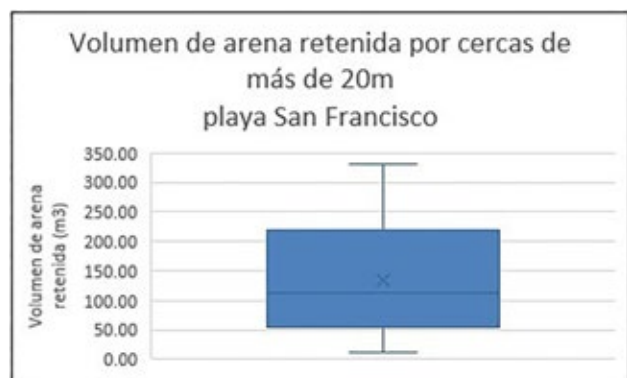
Figura 6. Arena retenida por cercas captoras de más de 20 m. de longitud.