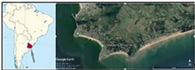
Figura 1. Localización del área de estudio.

Esta playa se localiza sobre el Río de la Plata, entre 34^{\circ}53'20.83'' S 55^{\circ}16'42.51'' O y 34^{\circ}53'49.84'' 55^{\circ}15'31.84'' y forma parte de un arco de playa que se desarrolla entre Punta Imán y Punta Colorada (Figura 1. Localización del área de estudio).