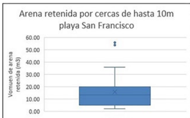
Figura 4. Arena retenida por cercas captoras de hasta 10 m. de longitud.