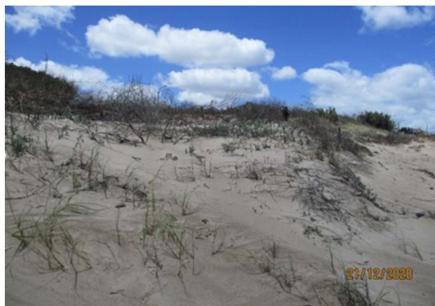
Figura 7. Arena retenida por cerca captora con revegetación natural.

Finalmente, las cercas con longitud superior a 20,00m tienen una mediana de 110,00m 3 y un amplio rango intercuartil que va desde los 50,00m 3 a 210,00m 3 de arena retenida (Figura 6. Arena retenida por cercas captoras de más de 20m de longitud). El volumen total de arena retenido en la base de las cercas captoras asciende a 2300m 3 , volumen un orden de magnitud menor que el calculado en base a los perfiles de playa.