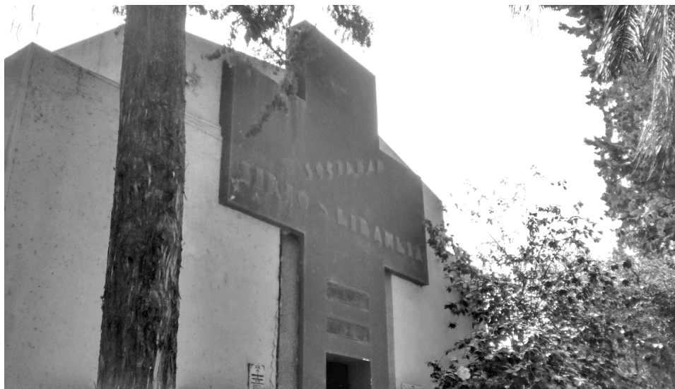
Imagen N°5: Panteón de la Sociedad Sirio Libanesa de Catamarca

Fuente: El autor. Cementerio Municipal de San Fernando del Valle de Catamarca.