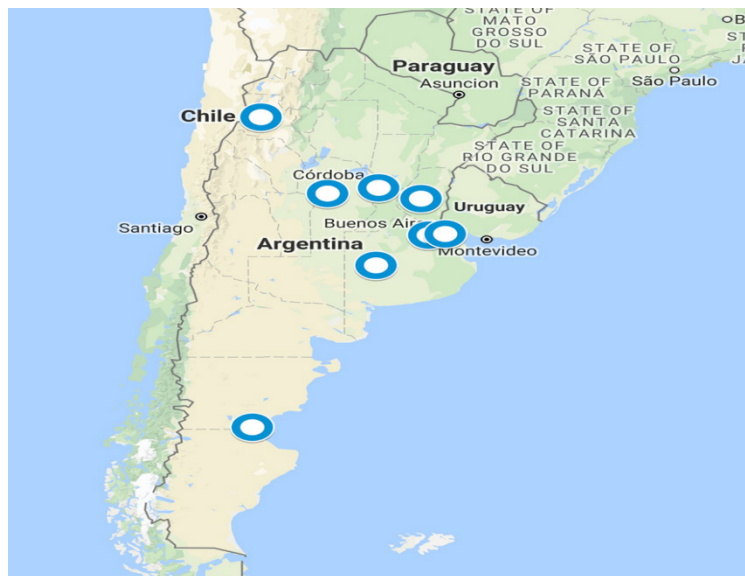
Mapa N°1: Cementerios recorridos en provincias de Argentina

Fuente: Elaboración propia en base a lo recorrido.