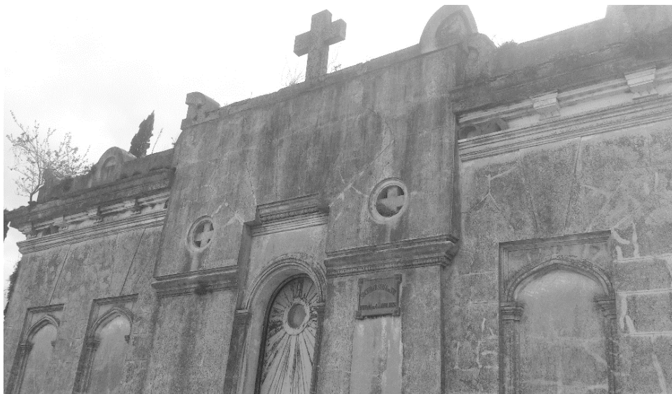
Cementerio Municipal de Pergamino.

En el mismo cementerio hay panteones de la sociedad francesa, española, dos italianos y varias tumbas irlandesas, evidenciando la importancia que tuvo esta ciudad para la migración y el modelo agroexportador, pero con antecedentes en haber sido una de las postas hacia el Alto Perú.