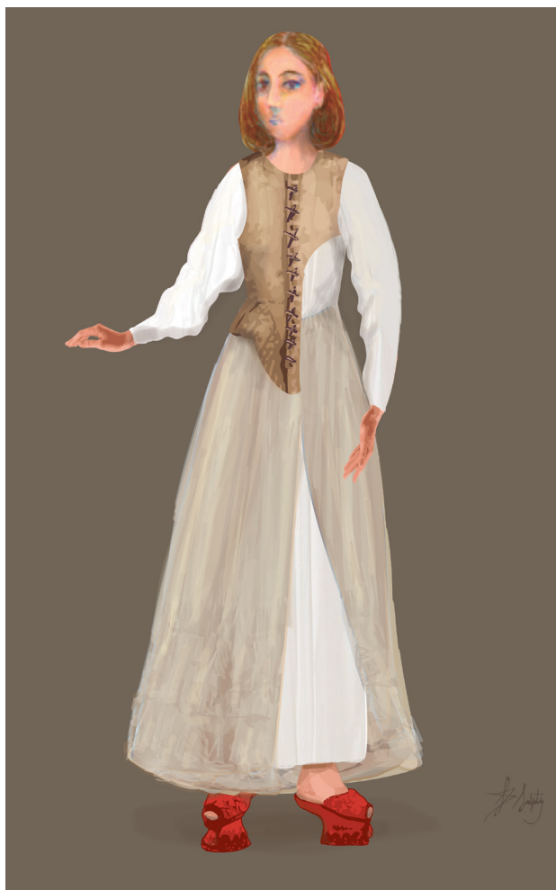
Figura n° 1: Ropa interior y semiinterior

denominar “saya entera” que a la vista daba la impresión de ser una sola pieza. El conjunto de prendas exteriores (saya y ropa) generalmente se denominaba “vestido”, situación que podía implicar también cierta combinación similar de telas, arreglos o detalles. Tal el caso del “ vestido de terciopelo morado guarnesido con sus franxas de oro anchas y la rropa con sus pasamanos de oro ” o el vestido compuesto por “ rropa y saya de terciopelo encarnado con sus franxas y franxones de oro ” que poseía Leonor de Tejada 53 . En los recibos y promesas de dote analizadas hemos identificado un total de 41 vestidos diferentes.