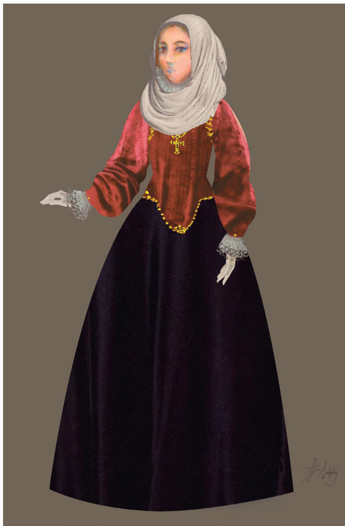
Figura n° 3: Ropa exterior completa

Prendas de abrigo: El manto era la prenda que con más frecuencia se usaba sobre la ropa y la saya; cubría el torso hasta la cintura o caderas y aunque podía estar elaborado de telas livianas y vistosas (de seda, burato, anascote, soplillo) también aparece confeccionado de lana. Las capas, capotes y capillejos de paño de lana aparecen con menor frecuencia en el guardarropa de las mujeres y más a menudo en el de los hombres. La poca variedad y cantidad de prendas de abrigo femeninas podría indicar cierta tendencia de las mujeres a permanecer en los espacios cerrados, íntimos y más resguardados de la intemperie. Resulta acorde con la lectura que Mariló Vigil realiza de la literatura española de la época,