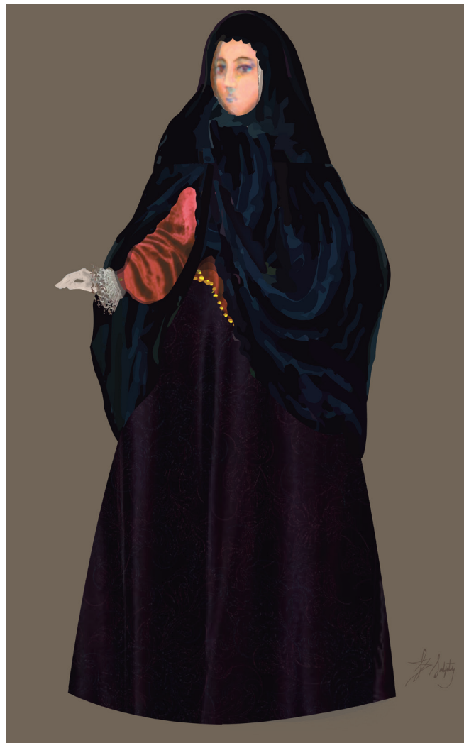
Figura 4: El manto y sus posibles usos

donde el ideal de los moralistas era la joven modosa, retraída y encerrada. El recogimiento y el recato eran virtudes valoradas en las doncellas, en especial las nobles 55 . Este ideal seguramente no fue trasladado de manera directa a América, pero sin duda pudo tener cierta incidencia en la constitución de la imagen de mujer hispanoamericana.