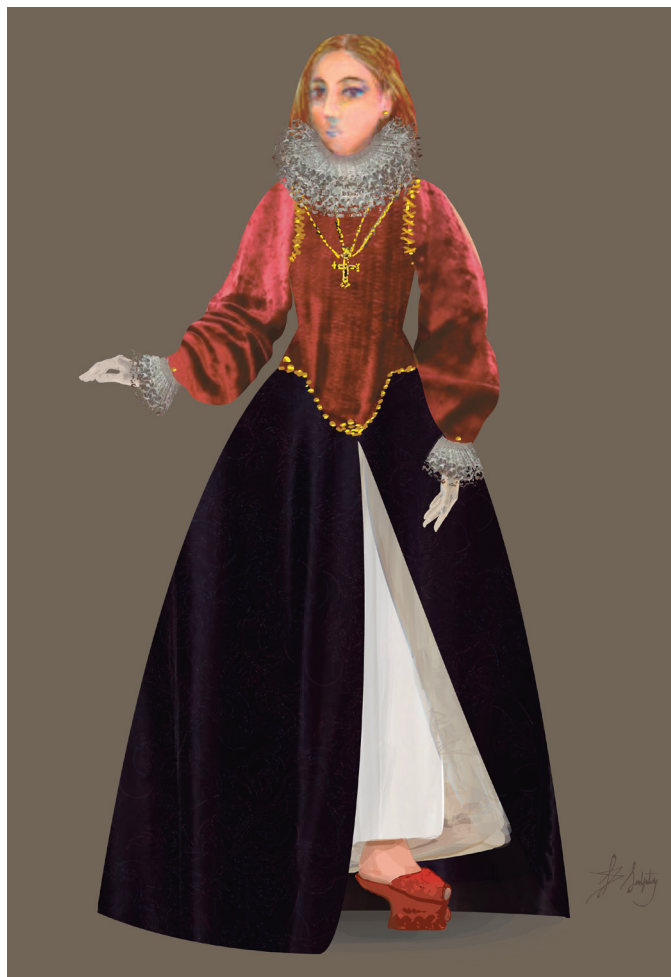
Figura n° 2: Ropa exterior en capas

Cobertura de la cabeza: la toca o tocado eran las prendas más frecuentemente mencionadas para la cobertura de la cabeza (aunque también se mencionan escofiones y escofietas). Estaban constituidas generalmente por una pieza rectangular de tela de seda o algodón de 1 o 2 varas de largo que se envolvía de diferentes formas o podía llevarse como velo o rebozo sobre la cabeza. No hay registros visuales locales sobre la forma en que se disponían estos tocados, aunque sí para otras regiones 54 .